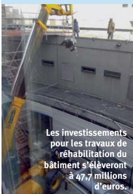
Les investissements pour les travaux de réhabilitation du bâtiment s'élèveront à 47,7 millions d'euros.

Radio France a prévu de consacrer 1 M€ aux équipements vidéo qui serviront notamment à la future chaîne d'information continue créée avec France Télévisions.